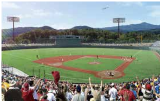
あづま球場完成イメージ