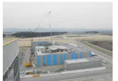
2月現在 工事進捗状況