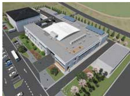
研究棟完成イメージ