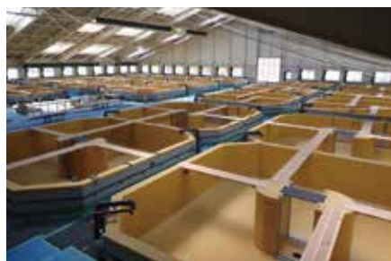
ヒラメ・アユ稚魚飼育棟