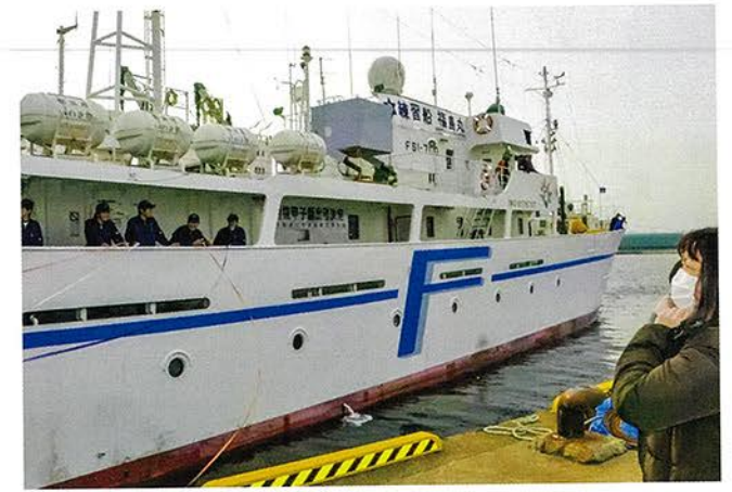
※小名浜海星高校 練習船「福島丸」新造船に努力しました