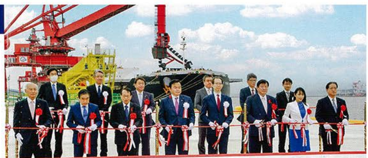
小名浜港国際バルクターミナル