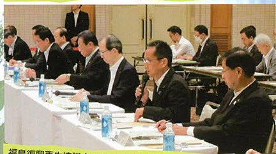
福島復興再生協議会の席上、復興、経産、農水、環境の各大臣に対して、福島の創造的復興について意見を述べました。