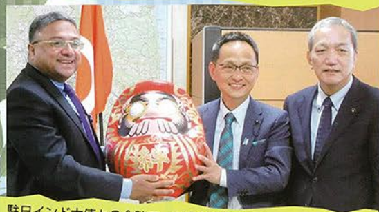
駐日インド大使との会談で、白河だるまをプレゼントし「ダルマ大使はインド人です」と伝えました。