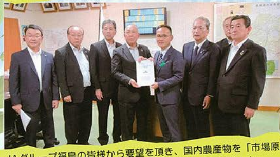
JAグループ福島の皆様から要望を頂き、国内農産物を「市場原理」から「食糧安保」の考えに進化させよう。と話しました。