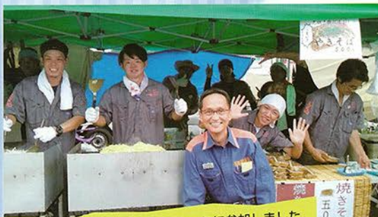
総合防災訓練の足で、大信まつりに参加しました。